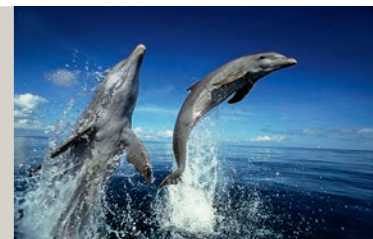
Konrad Wothe – Ein Leben für die Tierfotografie