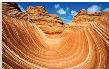
Norbert Rosing – USA – The West