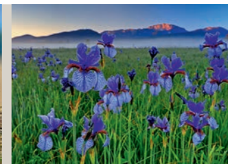
Bernd Römmelt – Natur vor der Haustür