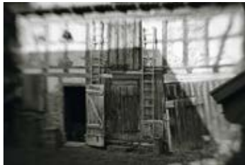
S/W-AG Süd – Aus reiner Leidenschaft ...