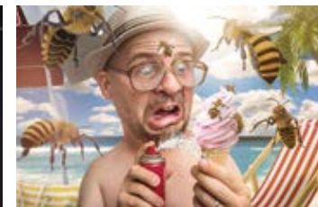
Matthias Schwaighofer – Photoshop