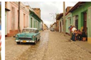
Pascal Violo – Cuba