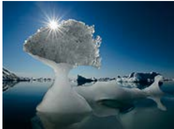
Stephan Fürnrohr – Geometry of Ice