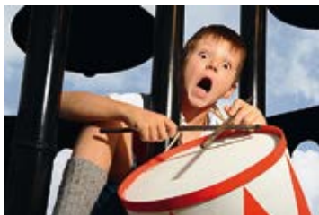
Laupheimer Fotokreis – Laemmles Erben