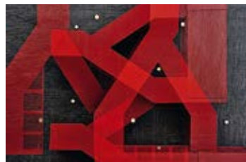
fotoforum Award – Highlights der Fotografie

„Highlights der Fotografie“ präsentiert ausgewählte Motive aus dem fotoforum Award. Die Ausstellung versammelt Arbeiten aus den Bereichen Landschaften, Tiere, Pflanzen, Architektur, Menschen und Experimentelles. Der fotoforum Award gehört mit über 18.000 Einsendungen zu den wichtigsten Fotowettbewerben im deutschsprachigen Raum.