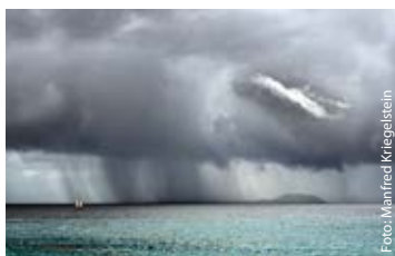
Manfred Kriegelstein – Lanzarote