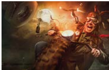
Matthias Schwaighofer – Bildbearbeitung