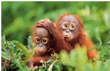
Konrad Wothe – Faszination Regenwald