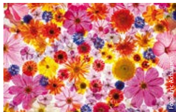
fotoforum Award – Highlights der Fotografie

„Highlights der Fotografie“ präsentiert ausgewählte Motive aus dem fotoforum Award. Die Ausstellung versammelt Arbeiten aus den Bereichen Landschaften, Tiere, Pflanzen, Architektur, Menschen und Experimentelles. Der fotoforum Award ist mit über 18.000 Einsendungen einer der erfolgreichsten Fotowettbewerbe im deutschsprachigen Raum.