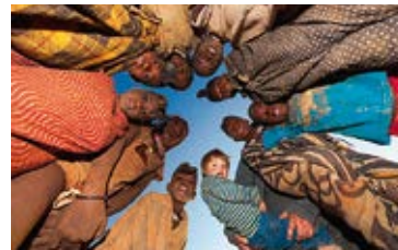
Josef Niedermeier – Afrika – Der Süden