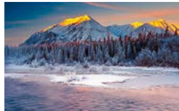
Franz Bagyi – Naturfotografie